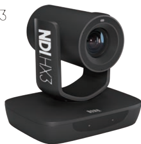
AMC-G320P AMC-NG320P(NDI HX3)